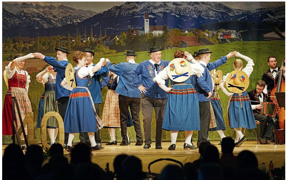
Die Trachtengruppe Römerswil am Heimatabend 2024.