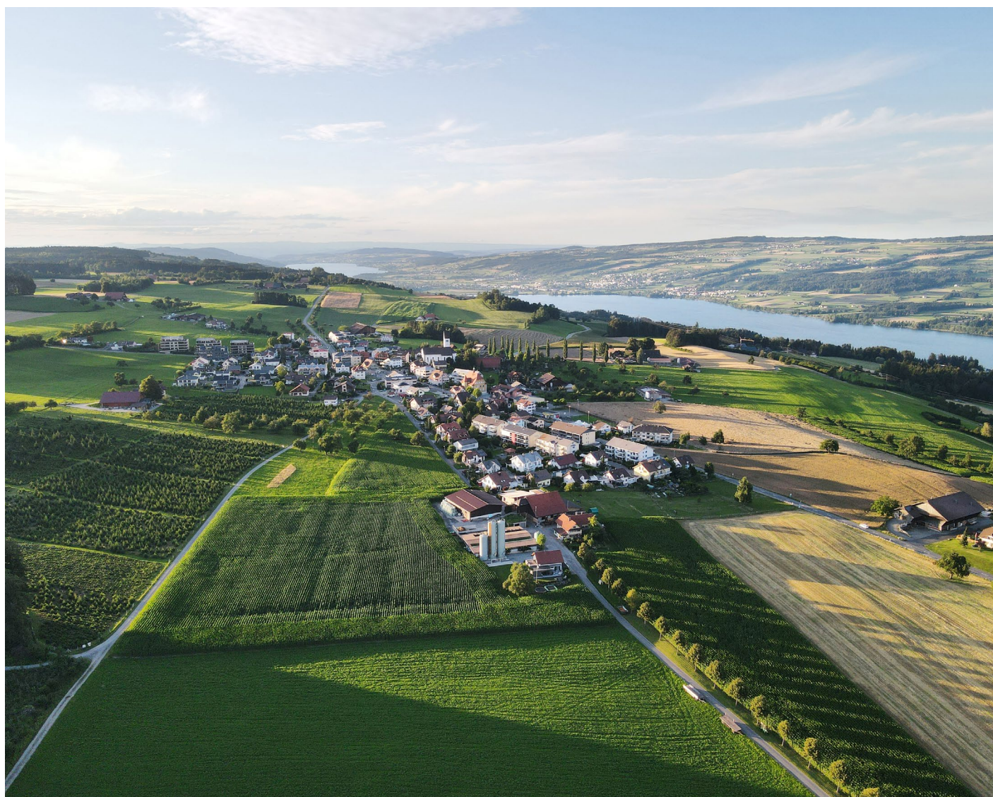
Eine lebendige Gemeinde über dem Nebel